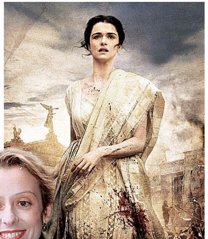
Rachel Weisz, Ipazia il film "Agorà" del regista cileno Alejandro Amenabar

«La fiaccola di cui Ipazia è stata portatrice non si è spenta. La filosofia di Alessandria d'Egitto è arrivata attraverso Bisanzio e Gemisto Pletone fino al nostro umanesimo, poi all'illuminismo ed alle altre correnti di idee che hanno spezzato l'omertà della Chiesa cattolica e fatto di Ipazia simbolo della libertà di pensiero».