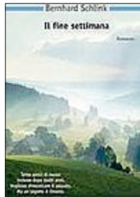
Bernhard Schlink IL FINE SETTIMANA Garzanti, 16,60 euro